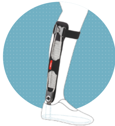
Agilium Freestep Classic

Door het gewricht te ontlasten komt er minder druk op uw knie. U kunt uw favoriete activiteiten weer oppakken en genieten! De Agilium Freestep verbetert direct uw levenskwaliteit.