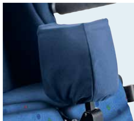
► Plot d'abduction